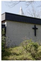
st. maximilian kolbe