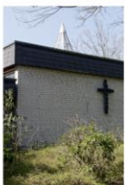
st. maximilian kolbe