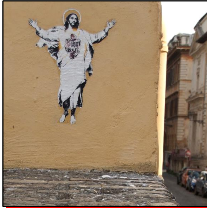
Graffito: „Auferstehung“ (Via della Lungara in Rom)

Pfarnachrichten digital: www.st-joseph-muenster-sued.de/info Archiv der Pfarnachrichten: www.st-joseph-muenster-sued.de/archiv